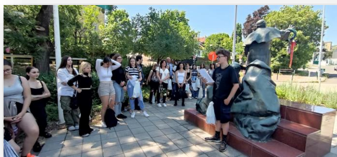
Boldog Apor Vilmos szobránál megemlékezés

Június 3-án pénteken a Nemzeti Összetartozás Napja alkalmából nyolcadikos tanulóink fogadták a nyárasdi iskola tanulóit. Az ünnepi megemlékezés részeként sor került egy közös éneklésre is. Az Ismerős arcok Nélküled című dalát énekeltük közösen, mely felejthetetlen élményt nyújtott valamennyi diák és pedagógus számára. Az iskolai programok után sétát tettünk a környéken. Diákjaink két helyszínen; a Boldog Apor Vilmos emlékműnél és Gróf Esterházy János szobránál történelmi emlékeztetőt tartottak, vendégeink pedig elhelyezték a megemlékezés virágait. Délután a két iskola diákjai együtt vettek részt a Csodák Palotájában szervezett foglalkozásokon.