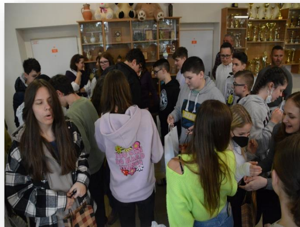
Nyárasdi Alapiskola - Ajándékozás

A fogadás után kezdetét vette a közös programok sorozata. Először a helyi diákok vezetésével végigjártuk a tantermeket, beültünk tanórákra, megismerkedtünk a legújabb projექtekkel.