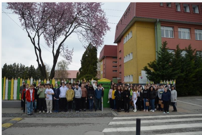
Nyárasdi Alapiskola - Németvölgyi Ált. Isk. találkozó

Ez az összeg fedezte a 55 tanuló és 6 kísérőtanár utazásának, szállásának, ellátásának és belépőinek költségeit. Sajnos a koronavírus járvány miatt az utazást tavaly el kellett halasztanunk, de idén lehetővé vált, hogy nyolcadikos tanulóink 2022. április 01. és április 03. között részt vegyenek a háromnapos felvidéki kiránduláson.